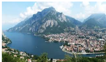
Lecce, "Salviamo la fontana di Santa Rosa" abbandonata nel degrado 26 SETTEMBRE 2016