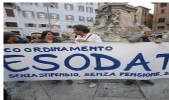
GIU' LE MANI DAL FONDO ESODATI! ' SALVAGUARDIA SUBITO PER TUTTI I 34.000 "ESODATI" ESCLUSI !!! 26 SETTEMBRE 2016