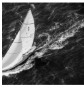
Aria (clicca per ingrandire)

Autore Serena Galvani, Editore A.R.I.E. dicembre 2016 - Pagg. 272 - Prezzo € 48,00 Per prenotazioni e ordini: www.arie-italia.it - www.serenagalvani.com -