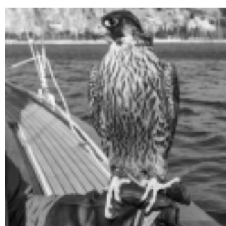
falco a bordo di Aria (clicca per ingrandire)