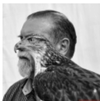
uomo con falco (clicca per ingrandire)