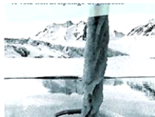
Svalbard, a vela nell'arcipelago del ghiaccio, il diario di bordo di una marinai...