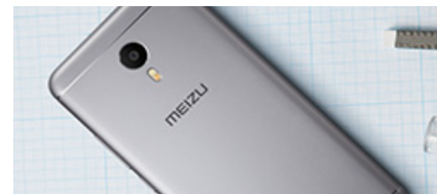
M3 Note: sottile, leggero e veloce, con batteria di lunga durata e display FHD