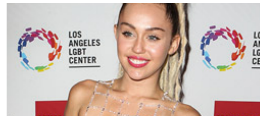
Miley Cyrus, un milione di dollari per girare un film particolare