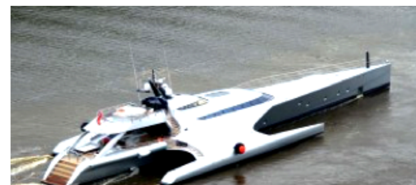
A Imperia stupisce il tri Galaxy of Happiness